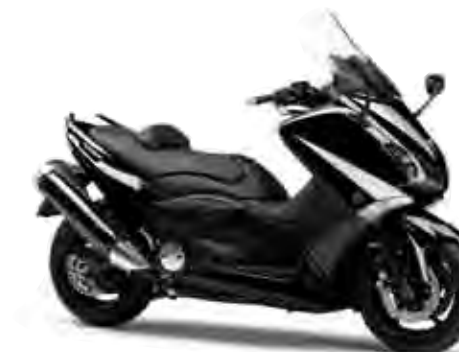
ブラックメタリックM (SMM)