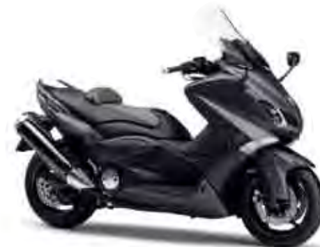
マットダークグレーメタリック1 (MDNM1)

*TMAX530(ティーマックスゴーサンマル)は(株)プレストコーポレーションが独自に設定した営業呼称です。 ●本仕様は予告なく変更することがあります。●仕様変更などにより写真や内容が一部実車と異なる場合があります。●ボディカラーは印刷の為、実車と異なって見える場合があります。 ●諸条件により取扱い商品が変更になる場合もあります。●ご使用前には取扱い説明書をよくお読み下さい。●このリーフレット紙面に記載されている内容は予告なく変更することを予めご了承願います。