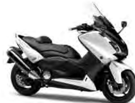
ブルーイッシュホワイトカクテル1 (BWC1)