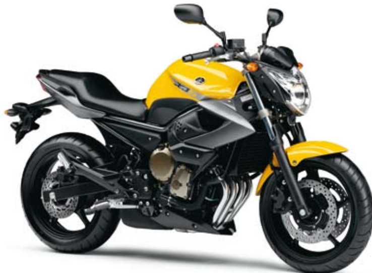
レディッシュイエローカクテル1 (RYC1)