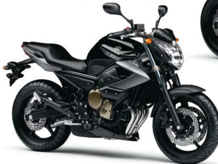
ブラックメタリックX (SMX)

●本仕様は予告なく変更することがあります。●仕様変更などにより写真や内容が一部実車と異なる場合があります。●ボディーカラーは印刷の為、実車と異なって見える場合があります。●諸条件により取扱い商品が変更になる場合もあります。●ご使用前には取扱い説明書をよくお読み下さい。●このリーフレット紙面に記載されている内容は予告なく変更することを予めご了承願います。