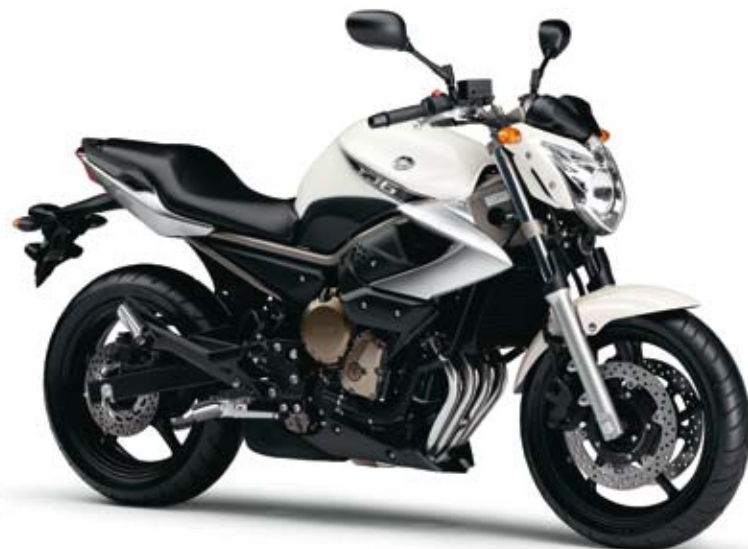
ニューパールホワイト (NPW)