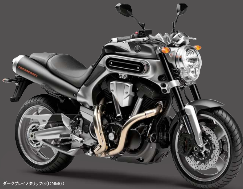
ダークグレイメタリックG (DNMG)