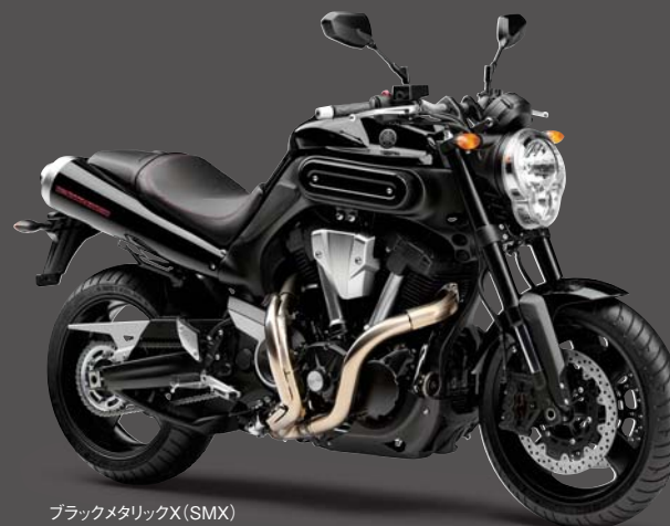
ブラックメタリックX (SMX)