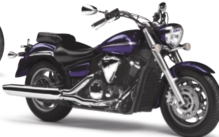
ダークパーブリッシュブルーメタリックL (DPBML)