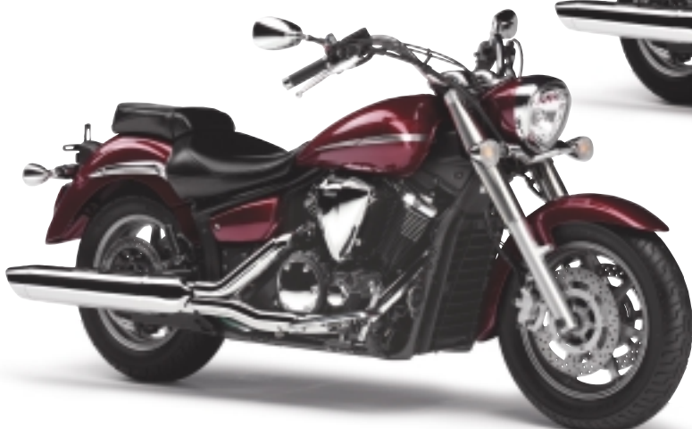
ベリダークレッドメタリック2 (VDRM2)