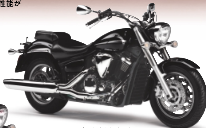
ブラックメタリックX (SMX)