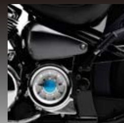
別体トランスファーとベルトドライブでスムーズな走行を実現。