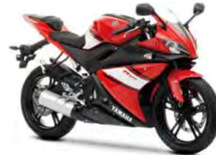
ビビッドイエロッシュレッド1 (VYR1) 2009MODEL