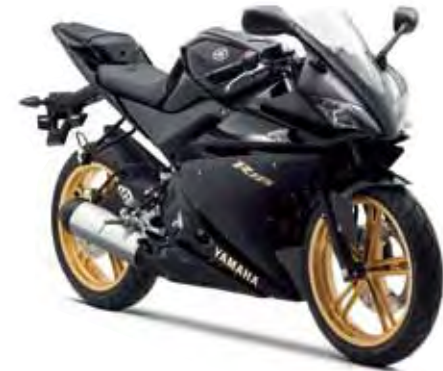
マットブラック2 (MBL2) 2010MODEL

●本仕様は予告なく変更することがあります。●仕様変更などにより写真や内容が一部実車と異なる場合があります。●ボディカラーは印刷の為、実車と異なって見える場合があります。●諸条件により取扱い商品が変更になる場合もあります。●ご使用前には取扱い説明書をよくお読み下さい。●このリーフレット紙面に記載されている内容は予告なく変更することを予めご了承願います。