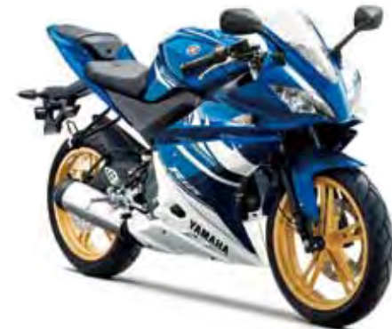
ディーパーブリッシュブルーメタリック13 (DPBM13) 2010MODEL