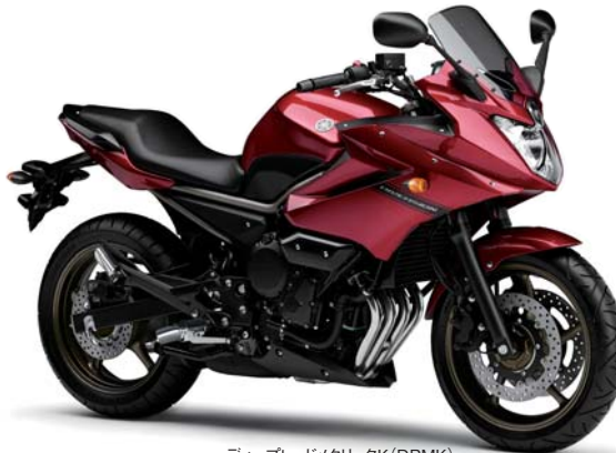
ディープレッドメタリックK (DRMK)

XJ6 DIVERSIONを共にするなら、退屈な毎日は一変するだろう。 フロントから、そしてテールから眺めたとときの流れるようなボディーライン。 扱いやすさを極めたエンジン、長距離ツーリングなどに効果を発揮するハーブカウル。 足着きの良いローシートや車体の軽さなど、ライダーを疲れさせない配慮も忘れていない。 ビギナーからベテランのライダーをも納得させるXJ6 DIVERSION。 バイクの原点である「走る楽しさ」が、ここにある。