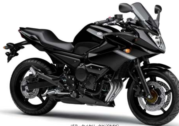
ブラックメタリックX (SMX)