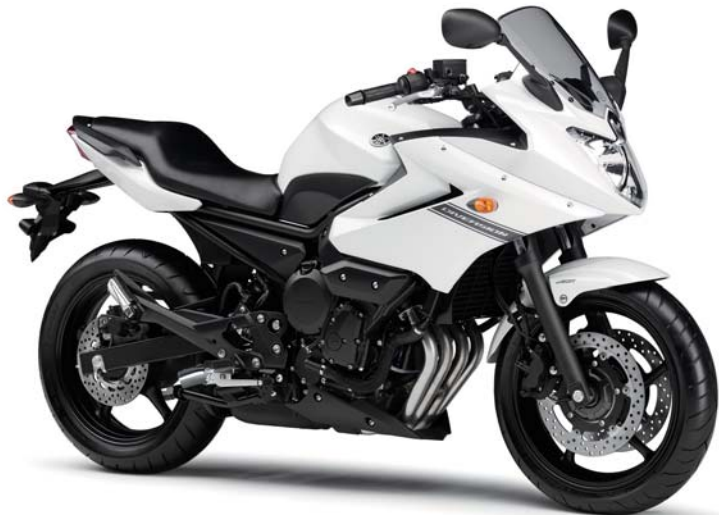
ブルーイッシュホワイトカクテル1 (BWC1)

XJ6 DIVERSIONを共にするなら、退屈な毎日は一変するだろう。 フロントから、そしてテールから眺めたとときの流れるようなボディーライン。 扱いやすさを極めたエンジン、長距離ツーリングなどに効果を発揮するハーブカウル。 足着きの良いローシートや車体の軽さなど、ライダーを疲れさせない配慮も忘れていない。 ビギナーからベテランのライダーをも納得させるXJ6 DIVERSION。 バイクの原点である「走る楽しさ」が、ここにある。