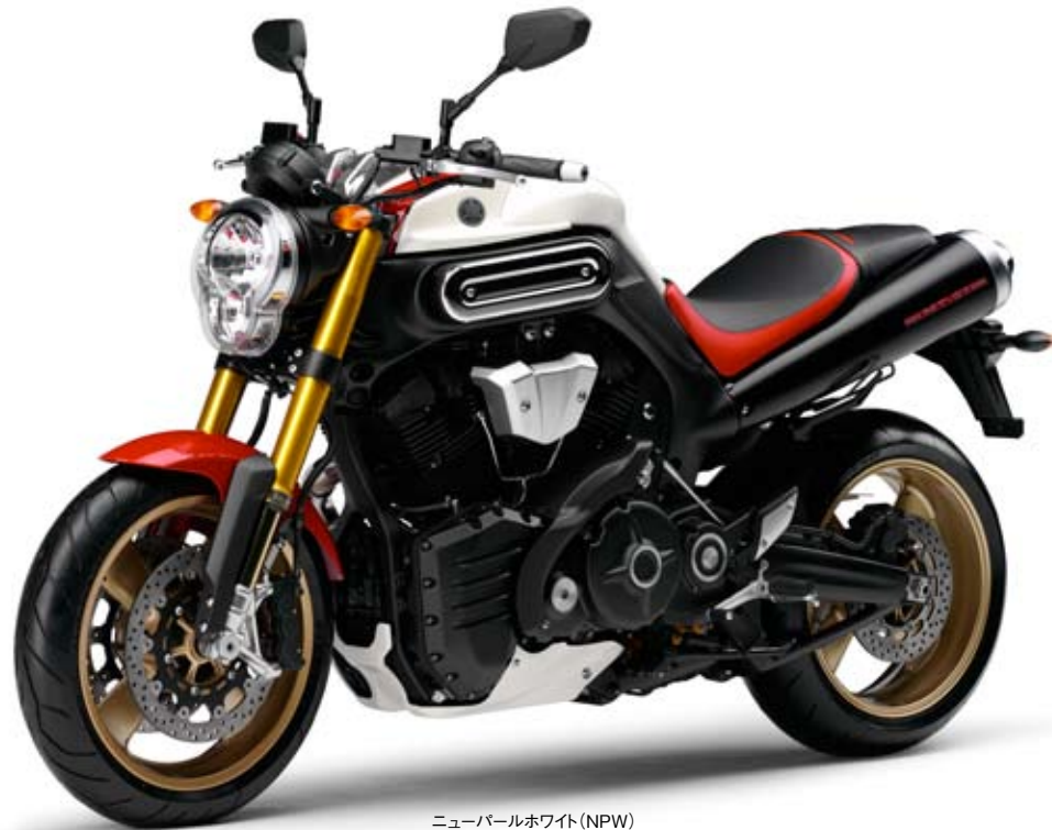
ニューパールホワイト (NPW)

先進の装備、新たなカラーを纏ったMT01Sが見せるパフォーマンスは、あなたの想像を遥かに越えていく。